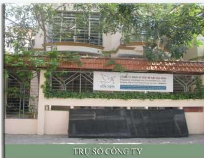
TRỤ SỞ CÔNG TY

Tell: (84-8) - 3511 - 1991 Fax: (84-8) - 3511 - 4686 Email: a@picon.vn http://www.picon.vn