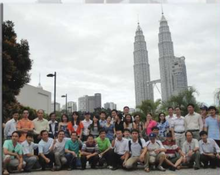
Các kỹ sư của PICON tham quan cơ sở hạ tầng ở Malaysia

Một trong những mục tiêu quan trọng của PICON là nâng cấp của các kỹ sư phải đạt tiêu chuẩn chất lượng quốc tế và phải lĩnh hội được những kiến thức chuyên môn tiên tiến nhất trên thế giới. Chương trình tham quan và học tập ở nước ngoài đã được tổ chức cho hầu hết các kỹ sư, và chuyên gia đến các thành phố lớn trên thế giới để họ tiếp thu được những kiến thức tiên tiến nhất về kỹ thuật hiện đại. Sau khi học tập và tham quan, những kiến thức và ý tưởng thiết kế này sẽ được nghiên cứu và áp dụng cho các dự án do công ty thực hiện. Ngoài ra những chuyến tham quan còn tạo nên một không khí làm việc năng động, sáng tạo và một tập thể tư vấn đoàn kết gắn bó.