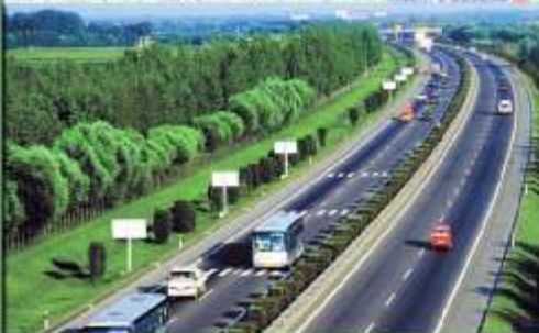
Đường cao tốc Tp.HCM - Long Thành - Dầu Giây