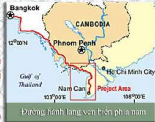
Đường hành lang ven biển phía nam