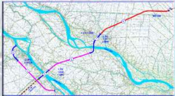
Dự án kết nối giao thông khu vực trung tâm Đồng bằng sông Cửu Long Dự án thành phần 6 tuyến Mỹ An – Cao Lãnh

thực hiện các công việc khảo sát, lập Thiết kế cơ sở và Dự án Đầu tư cho 24 cây cầu, 26 km đường mới và xử lý nền đất yếu.