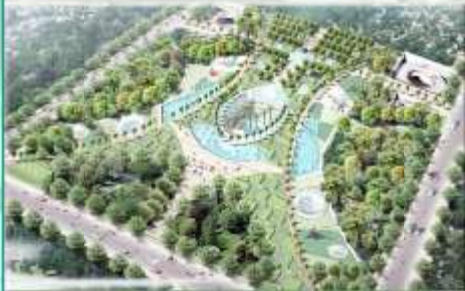
Bãi xe ngầm dưới Công viên Lê Văn Tám