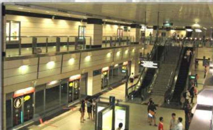
Các kỹ sư của PICON tham quan hệ thống tàu điện ngầm ở Singapore