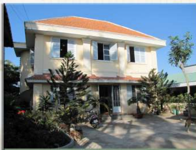
PHÒNG THÍ NGHIỆM (LAS No. 838)

Tell: (84-8) - 3726 - 6239 Fax: (84-8) - 3726 - 0030