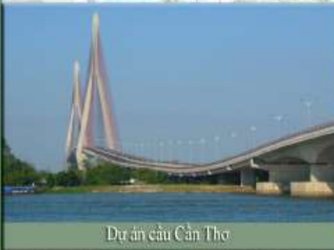
Dự án cầu Cần Thơ