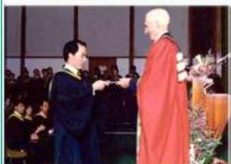
Lễ nhận bằng của Giám đốc Hà Tiên Nha tại Học viện Kỹ thuật Châu Á (AIT), 1996