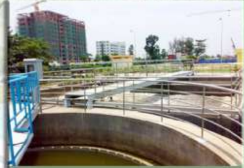
Trạm xử lý nước thải khu công viên PM Quang Trung